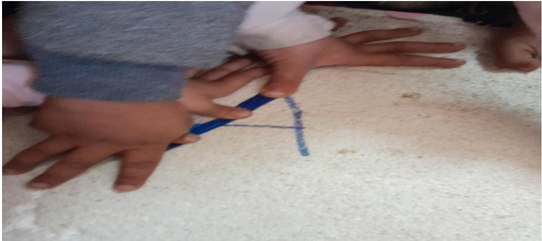
شكل ( ٣ ) نموذج من استخدام الاطفال لشريط موبايوس في تشكيل لبعض حروف اللغة الانجليزية