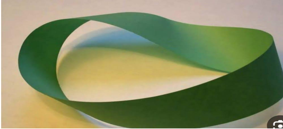
شكل ( ٢ ) نموذج توضيحي لشريط موبايوس بصورته الخام

الربط بين شريط موبايوس ومهارة الكتابة باللغة الإنجليزية لطفل الروضة ( دراسة تطبيقية )